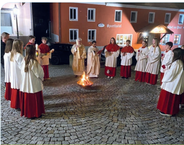
In der Osternacht werden am Feuer die Kerzen entzündet.