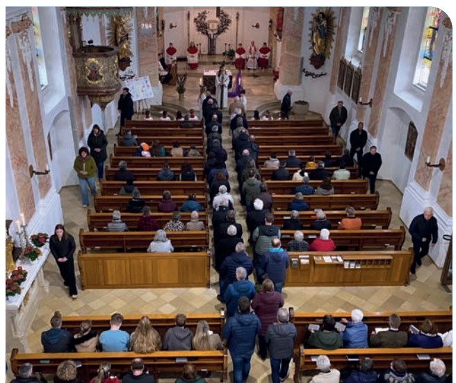
Kreuzverehrung bei der Karfreitagsliturgie