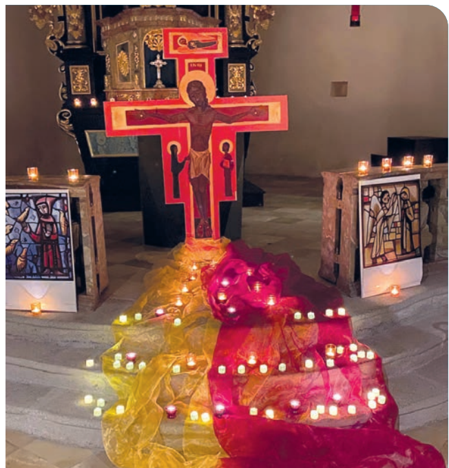
Stilvoll geschmückte St. Jodok-Kirche