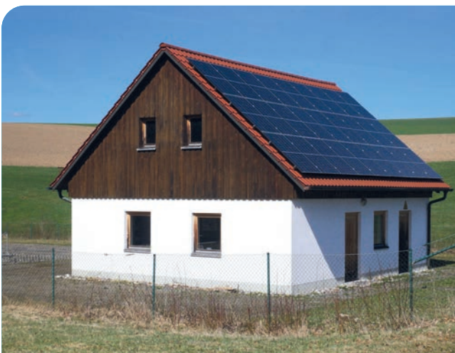
Neu eingedecktes Betriebsgebäude der Kläranlage Kleinschwand mit Photovoltaikanlage.

Das Dach des Kläranlagengebäudes war sanierungsbedürftig und sollte erneuert werden. Um sich erhebliche Kosten zu sparen packten die Kleinschwandner selbst an. Unter fachlicher Anleitung von Thomas Galli wurden fast alle Arbeiten an mehreren Wochenenden in Eigenleistung erbracht. So wurde das alte Dach samt Lattung und Dachpappe abgerissen, neu eingelattet und neu gedeckt. Bei den Spenglerarbeiten stand Josef Raab zur Seite. Eine PV-Anlage, geliefert von Markus Sier, wurde zusätzlich noch installiert.