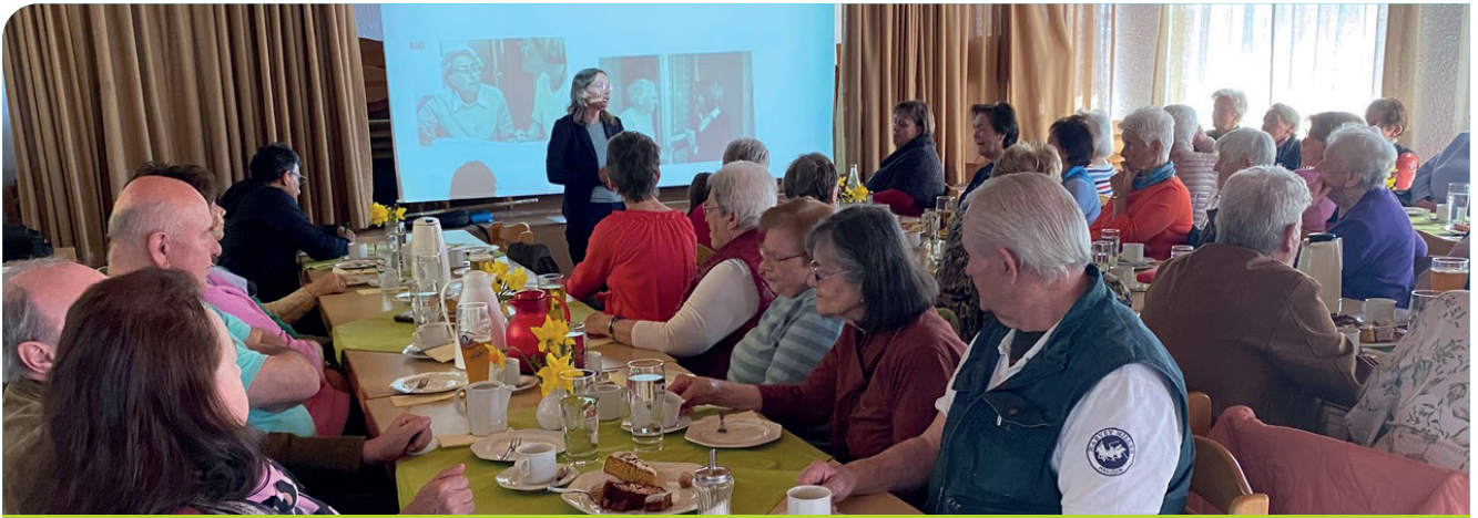
Vorsorgevollmacht und Patientenverfügung fand großes Interesse.

durchzuführen und welche zu unterlassen sind. Dabei geht es insbesondere um Situationen (z.B. unheilbare Krankheit, schwerer Unfall, Demenz, Wachkoma), in denen über die Anwendung lebensverlängernder Maßnahmen (z.B. künstliche Ernährung und/oder Beatmung) entschieden werden muss. Die in einer gültigen Patientenverfügung festgehaltenen Wünsche sind verbindlich für das medizinische Personal.