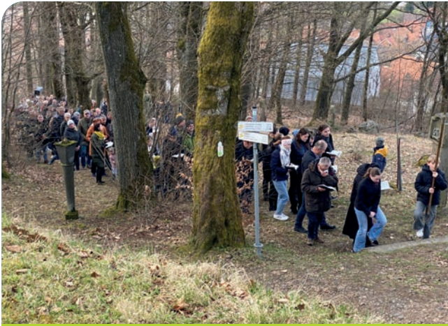
Steil ging es am Karfreitag den traditionellen Kreuzweg auf den Schloßberg