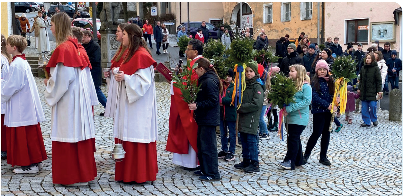
Künftige Kommunionkinder symbolisieren mit ihren Palmbuschen den Einzug Jesu in Jerusalem.

Die musikalische Umrahmung gestaltete der Kirchenchor Tännenberg mit der „Haydn-Messe“ und Zwischengesängen. Vor dem Kirchengebäude boten Mitglieder des Frauenbundes symbolträchtigen Oster schmuck für zu Hause an.