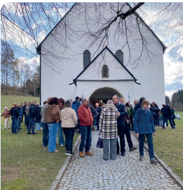
Der Ostermontag gehörte den „Emausjüngern“ in der St. Jodokkirche.

Nach Segnung des Osterfeuers außerhalb der Kirche, Bereitung und Entzündung der Osterkerze und Einzug mit der Osterkerze unter dem dreimaligen Ruf „Lumen Christi“ in die dunkle Kirche, wurde allen Gläubigen das Licht der Osterkerze gereicht. Beim Gloria läuteten alle Glocken und die Orgel erklang wieder. Dabei wurden die Altarkerzen entzündet. Nach der Taufwasserweihe erneuerten die Gläubigen ihr Taufversprechen und wurden mit dem soeben geweihten Taufwasser besprengt. Die anschließende feierliche Eucharistiefeier wurde vom Kirchenchor mit der Fortsetzung der „Turmbläser-Messe“ umrahmt. Zwölf Ministrantinnen und Ministranten leisteten ihren Dienst zur würdigen Gestaltung der von Pfarrer Joseph in Kozelebration mit Diakon Janusz Szubartowicz zelebrierten Liturgie.