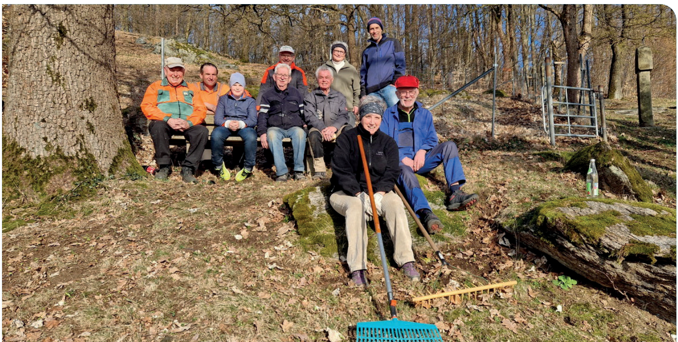
Nach getaner Arbeit gab es eine Brotzeit.

Laub, Äste und sonstiger Unrat wurden gründlich entfernt. Auch die Wege rund um die Anlagen und vor der Auferstehungskapelle wurden sorgfältig gesäubert. So können Spaziergänger und Besucher den traditionellen Kreuzweg wieder sicheren Schrittes begehen.