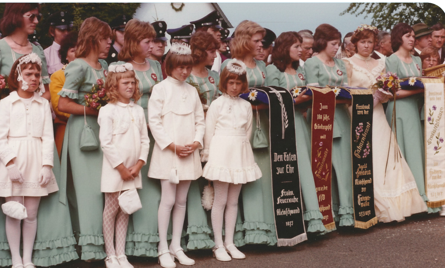
Die Festdamen und Festmädchen des 100-jährigen Gründungsjubiläums 1975.