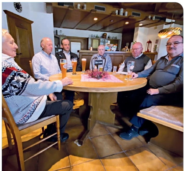
Aufmerksamer Zuhörererkreis beim religiösen Frühschoppen.