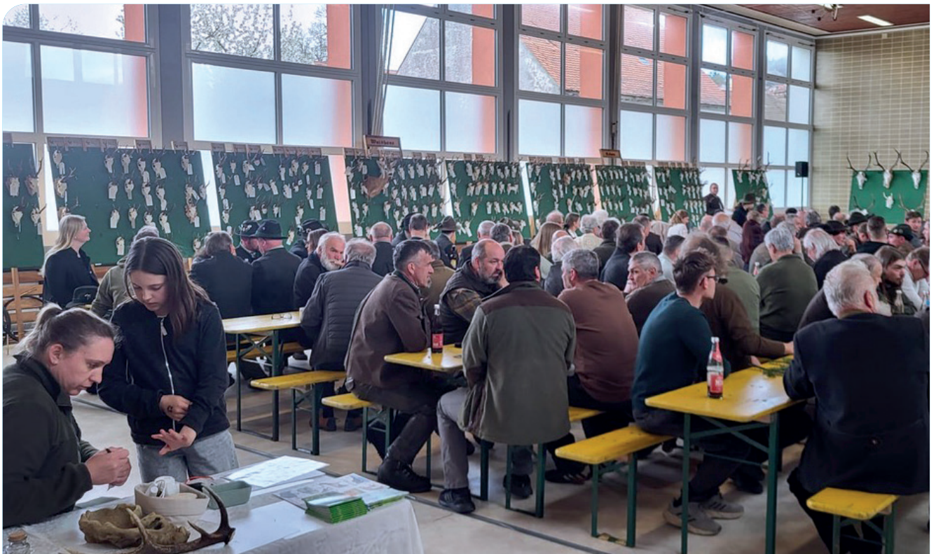
Trophäenausstellung und Vorträge in der Schulturnhalle

Text: Florian Forster - Bild: Florian Forster