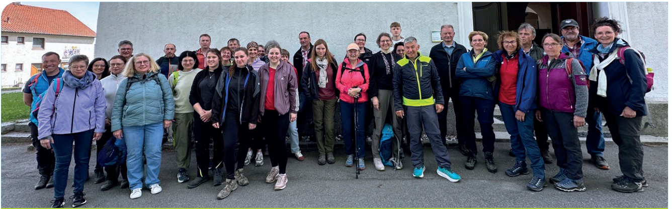
Ankunft bei der Wallfahrtskirche Fahrenberg

Konzelebration mitfeierte. Die Fußwallfahrt war wieder ein besonderes Erlebnis, das den Gemeinschaftsinn in der Pfarreiengemeinschaft Vohenstrauß-Tännesberg eindrucksvoll zum Ausdruck brachte und den Glauben in der Natur lebendig werden ließ.