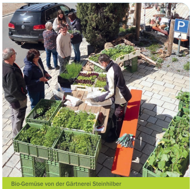
Bio-Gemüse von der Gärtnerei Steinhilber