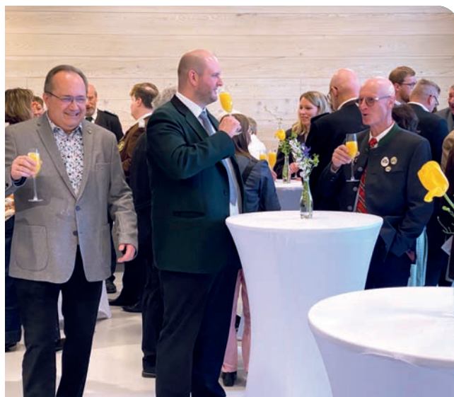
Bürgermeisterempfang im „Haus der Biodiversität“