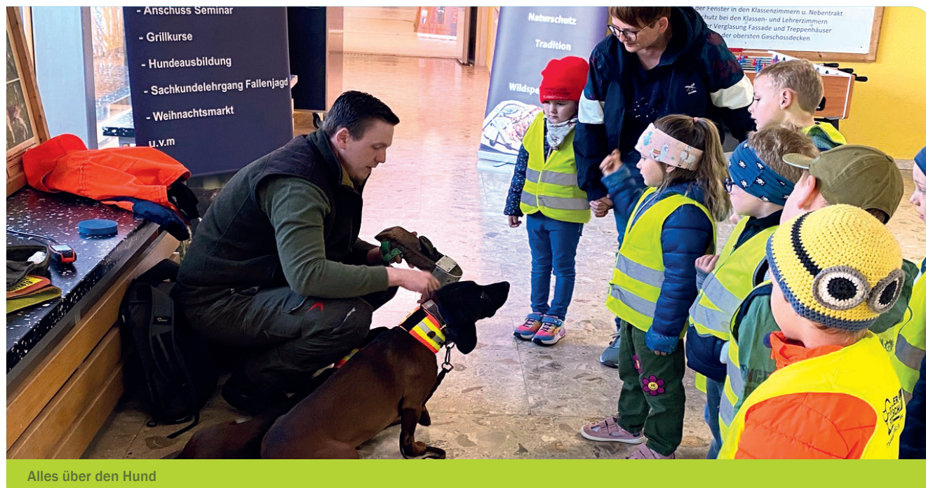
Alles über den Hund

Der bayerischen Jägerschaft liegt es sehr am Herzen, die Kinder für die Natur zu interessieren und Zusammenhänge zu erfassen.