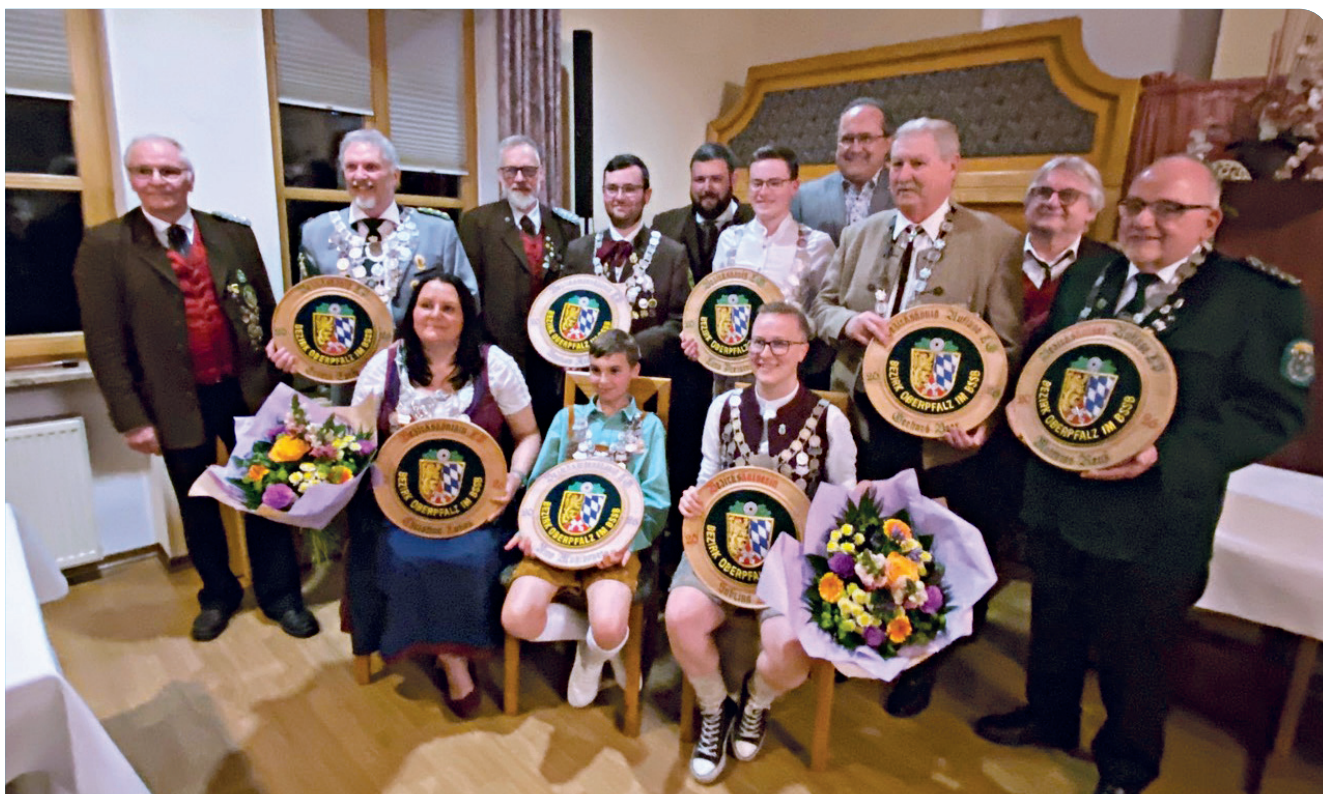
Die neuen Bezirksschützenkönige/-königinnen.