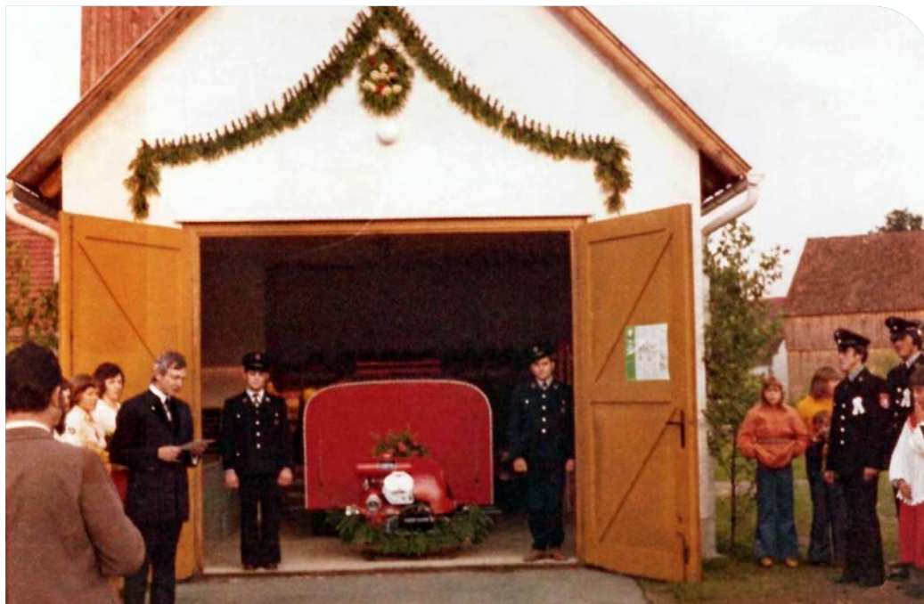
25. Juli 1975: Weihe der TSF 8 Tragspritze am Gerätehaus der Freiwilligen Feuerwehr Kleinschwand.