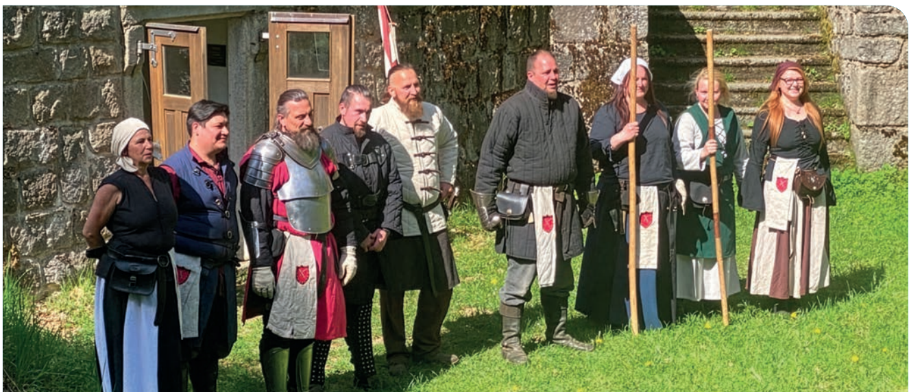
Die Schaukampfgruppe Schwertbrecher