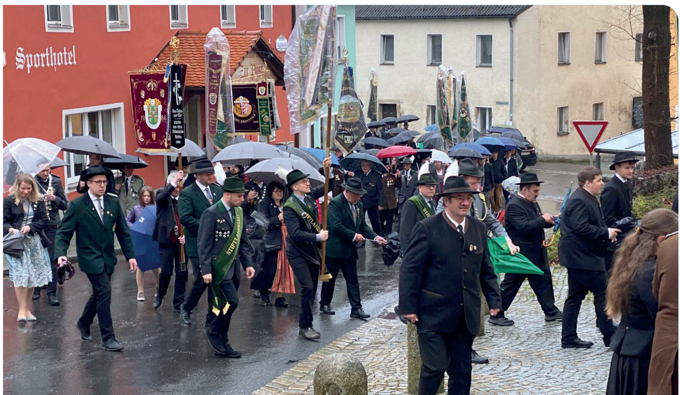
Einmarsch in die Pfarrkirche „St. Michael“