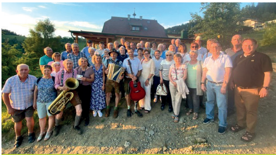
Hoch hinauf ging es zur Jausenstation Stubinger.