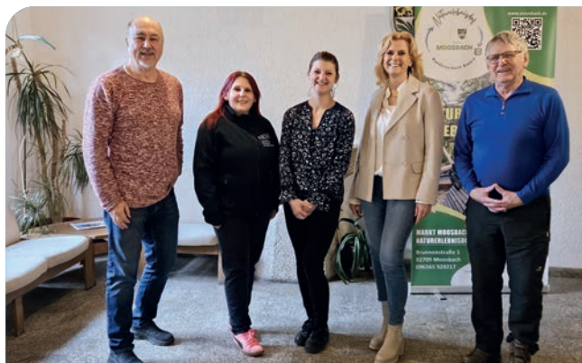
Die Jury, bestehend aus Vertretern aus Tourismus, Ehrenamt, Politik und Wirtschaft, prüfte alle eingegangenen Unterlagen und entschied sich für 17 Kleinprojekte.

In diesem Jahr gab es für das Regionalbudget im Naturparkland Oberpfälzer Wald mehr Anträge und auch mehr positive Bescheide als je zuvor. In zwei Förderaufrufen bis März 2026 wurden 21 Anträge für Förderungen aus dem Regionalbudget an die ILE Naturparkland Oberpfälzer Wald gestellt. Die Jury, bestehend aus Vertretern aus Tourismus, Ehrenamt, Politik und Wirtschaft, prüfte alle eingegangenen Unterlagen und entschied sich für 17 Kleinprojekte. Diese werden mit 80 % der Nettokosten gefördert, jedoch maximal 10.000 €. Das entspricht einer Fördersumme von rund 83.000 €. Alle Ideen verfolgen keine Gewinnerzielungsabsicht und bringen einen allgemeingesellschaftlichen Nutzen in ihre Gemeinde.