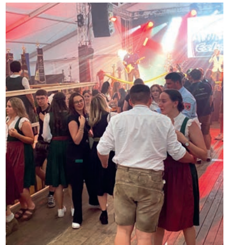
Die „Eslerner“ heizten kräftig ein.