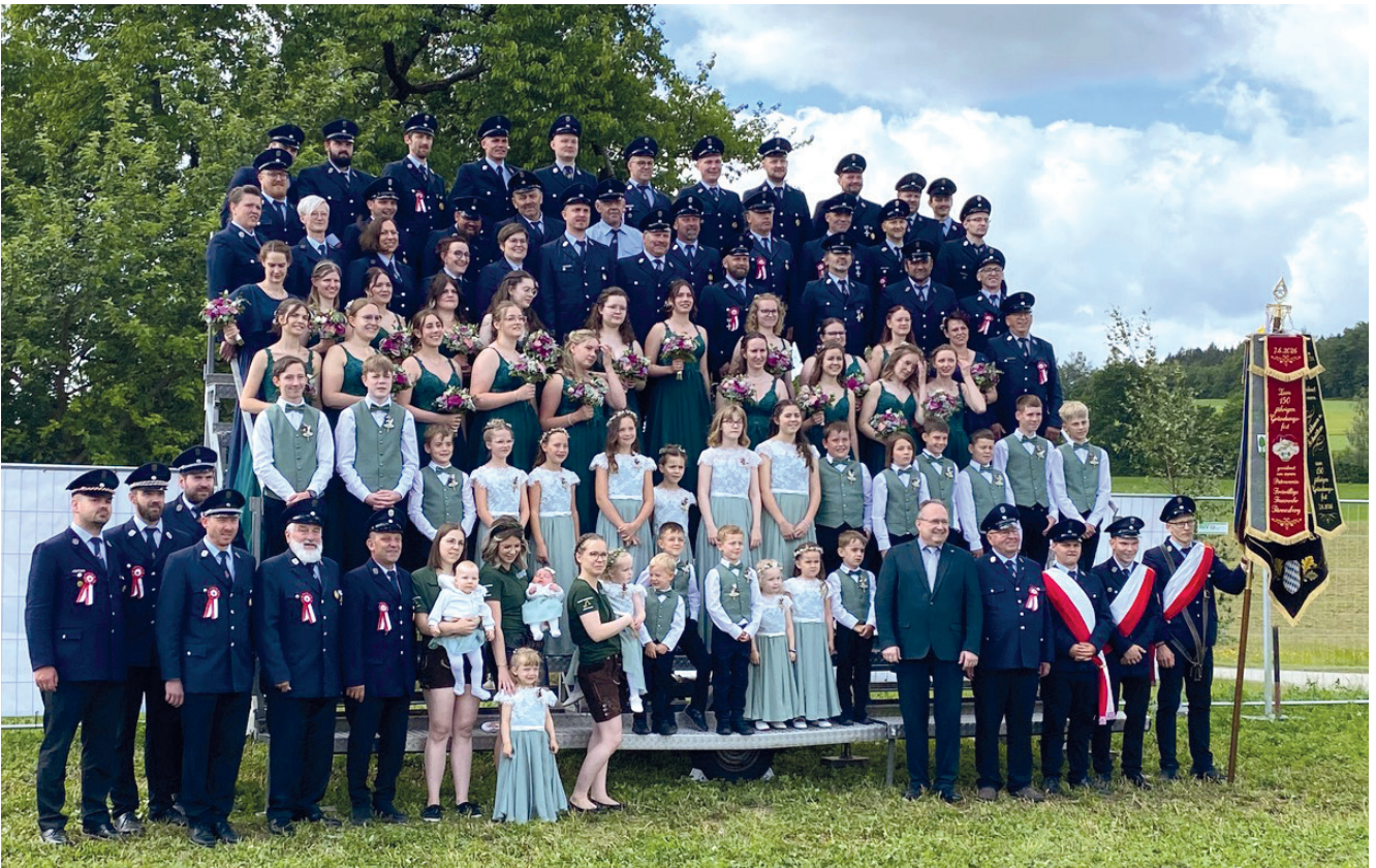
Die Jubelwehr zur Erinnerung an das 150 jährige Gründungsfest.