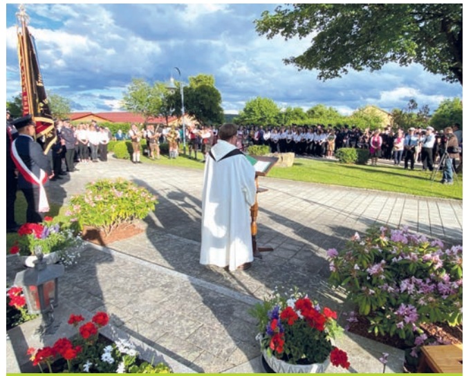
Totengedenken am Ehrenmal.