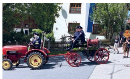
Histor. Löschgerät der FFW Großenschwand.