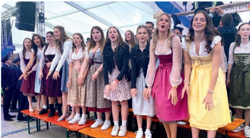
Die Festdamen des Patenvereins Tännesberg feierten kräftig mit.