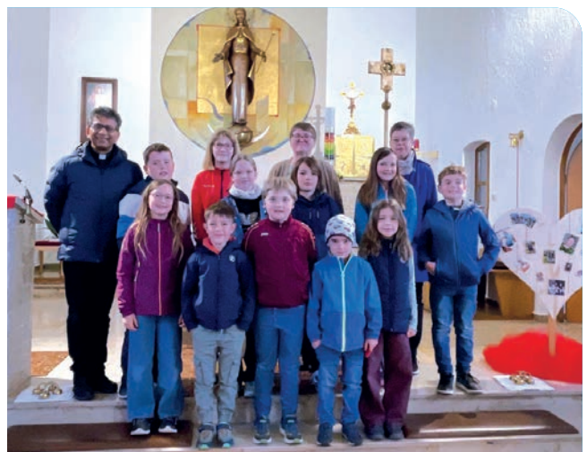
Nicht nur die Kinder freuten sich über ihren Einsatz.