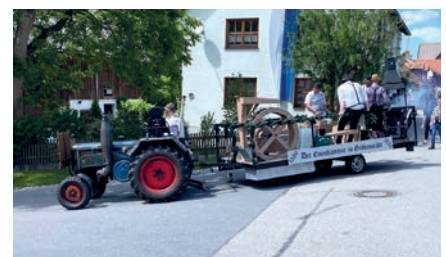
So wurde früher gearbeitet.