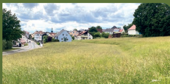
Im Baugebiet „Am Kohlbuch II“ soll größtmögliche Gestaltungsfreiheit gegeben sein.

Einstimmig billigte der Gemeinderat unter Berücksichtigung der besprochenen Änderungen sowohl die Änderung des Flächennutzungsplans Tannesberg als auch den Vorentwurf des Bebauungsplans „Am Kohlbuch II“ zur Auslegung und Beteiligung der Öffentlichkeit und der Träger öffentlicher Belange.