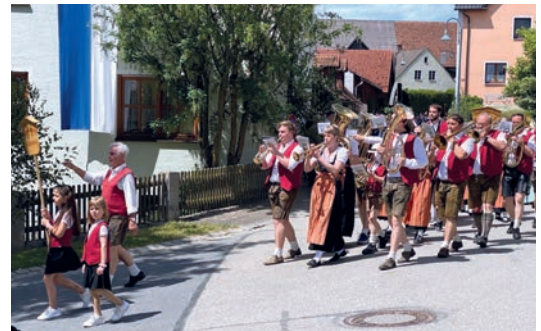
Die Gleiritscher Blaskapelle gab an der Spitze des Festzugs den Takt an.