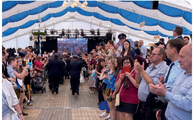
Nach dem Festzug war das Zelt voll.