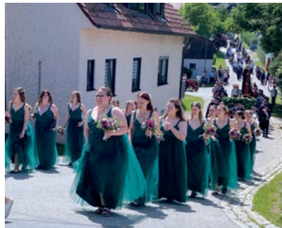
Schön anzuschauen waren die Festdamen mit ihren schicken Kleidern.