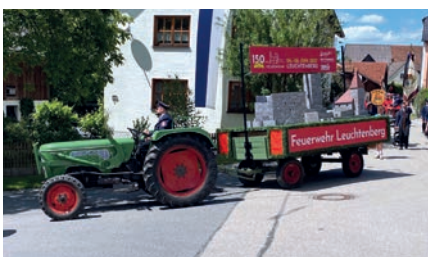
Die FFW Leuchtenberg brachte ihre Burg mit.