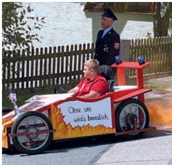
Der Nachwuchs steht bereit.