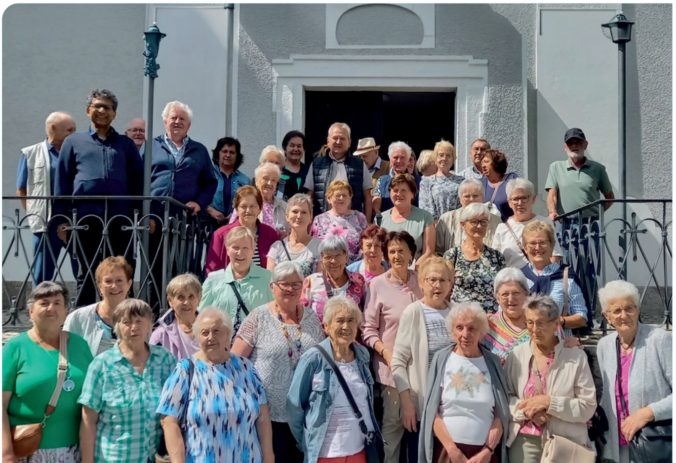
Fuchsmühl war für die Senioren eine Reise wert.