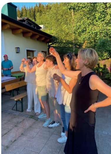
Ein Prost mit harmonischem Klang.

Am Pfingstmontag machte sich eine rund 40 köpfige Reisegruppe der Pfarreiengemeinschaft Vohenstrauß-Tännesberg auf zum „Tor nach Süden“, in das österreichische Kärnten. In Villach angekommen, wurde sich der erste „Longdrink“ auf der sonnendurchfluteten Plaza vor dem Hotel genehmigt.