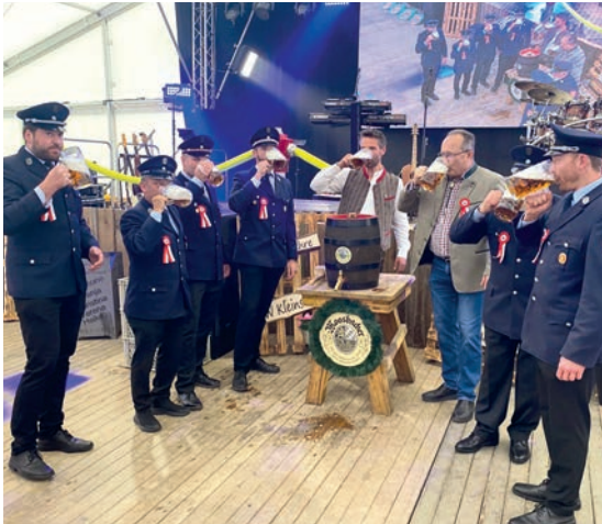
Die erste, frisch gezapfte Maß schmeckt am besten.