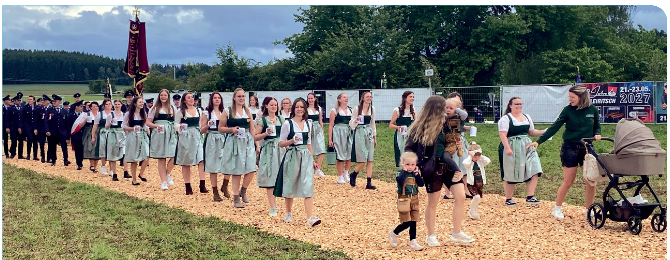
Einzug der Festdamen in das Festzelt zur Eröffnung der Feierlichkeiten.

Mit mehreren Salven begrüßten die „Schloßbergböller“ des Schützenvereins Tannesberg unter den Klängen von „Bayrisch Blech“ den Einmarsch des Festkomitees mit den Ehrengästen und Fahnenabordnungen der Patenvereine zur Eröffnung der Feierlichkeiten.