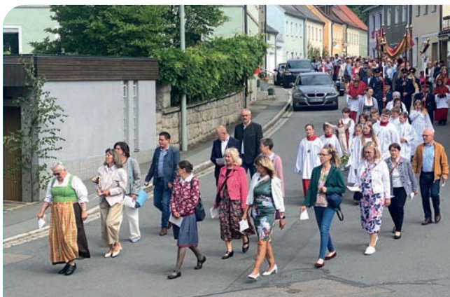
In feierlicher Prozession wurde das Allerheiligste durch die Straßen von Tännesberg getragen.